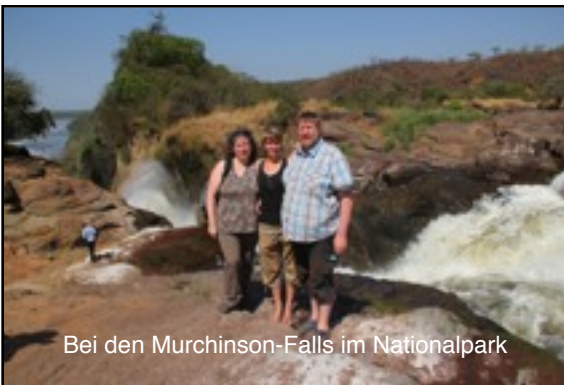
Bei den Murchinson-Falls im Nationalpark

Am 1. Februar sind meine Eltern zu Besuch gekommen. Ich hatte sie in Entebbe, Uganda vom Flughafen abgeholt und wir hatten wundervolle zwei Wochen zusammen. Von Safari über Kampala-Innenstadt bis zu meiner Station war alles dabei. Leider verging die Zeit viel zu schnell.